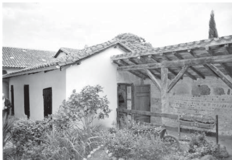
Fara, ve které bydlel sv. Jan Maria Vianney.