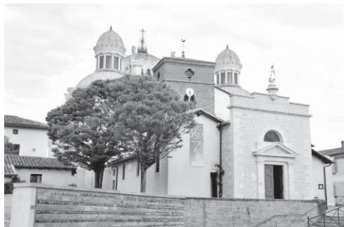
Kostel v Arsu.